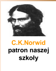
C.K.Norwid patron naszej szkoły